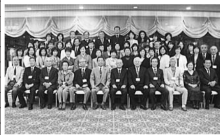
平成20年10月に集まった丘上会

今や、わが同窓生は国の内外で、数々の職場・社会で中核となって活躍しています。この肥大化した会を如何に機能的・組織的に運営していくかの課題が、本部役員に課せられた役割だと思っていま。現在、会の運営は中学1回から18回、高校1回から61回の各学年の会、東京・関西等の九地域支部、定時制部会、福岡市役所、県警察等の職域です。定期総会の当番は32回生です。ご承知のとおり、一昨年の海北前会長の時から、単一学年実行委員会制を採ることになりました。八十年周記念総会を30回生が大変な努力と創意工夫で大成功に導いてくれました。昨年は31回生がその流れを引き継いで今年当番の32回生に渡してくれました。