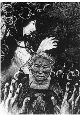
題名「解放」 書名「エンジェル エンジェル エンジェル」

印象になりました。また、踵のない革靴(ローファー)の着用も認められるようになりました。男女ともシャツや女子のベストには校章の刺繍が入り、どの時期にどのような組み合わせでも、胸に校章がある姿になっています。二、三年生は高校6回の女子生徒一期生の先輩方から五十年以上大切に受け継がれてきた現在の制服を最後に着るものとして、新入生は新たな伝統の第一歩を作るものとして、筑高生としての誇りをもって制服を着こなしてほしいものです。(高38 宮本智朗)