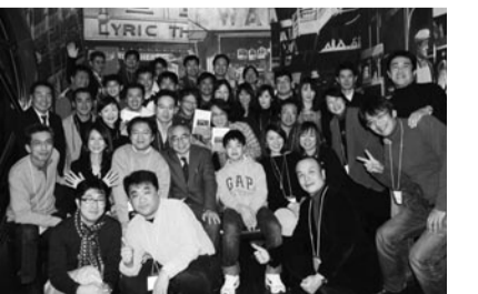
大いに盛りあがった高40回同窓会