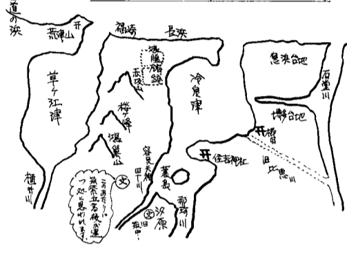
鎌倉中期頃の博多湾の形状(推定)

「幸せ」「福」を呼ぶ平和な国となることを願う歌である。その歌題に沿って一族もそれぞれに福岡という地名、城下藩領の幸せを願って歌を連ねた。