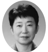
筑紫丘高校同窓会会員の皆様にお

おかげさまで自分なりに一定の役割を果たすことができたと考えております。 今後は一会員として母校および同窓会の発展のため務めを果たして参りたいと考えております。