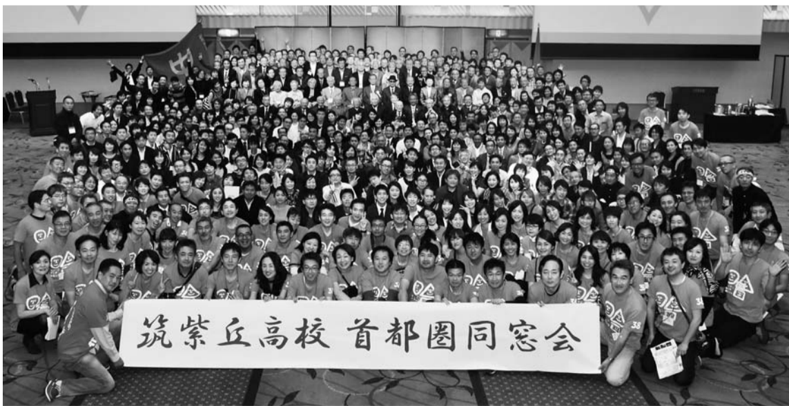
筑紫丘高校 首都圏同窓会