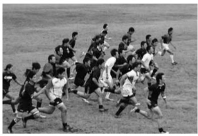
夏合宿で力走するラグビー部員たち

年度には地区大会の決勝まで進出しましたが、全国大会出場とはなりません。現在は部員が少なくなっているものの、本気で全国大会出場を目指して練習内容なども試行錯誤しながら、顧問の村先生や他のコーチの方々のもと頑張っています。昔はラグビーといえば紳士が行うスポーツで人気を誇っていましたが、近年はけがや汚れることを敬遠してなかなかラグビー部の門をたたいてくれる人はいません。