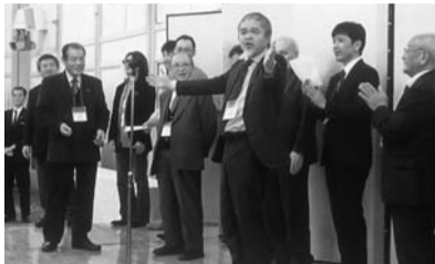
「応援歌」で締められた新春の集い＝福岡ガーデンパレスで

平成28年1月16日(土)午後4時半から「福岡ガーデンパレス」にて新春の集いを開催しました。この日は同3時から常任幹事会を開催し、その後、学校長をはじめ学校4役およびPTA役員ならびに各種委員会委員らに加え、定期総会実行委員会の委員を含む94人の出席をいただきました。学校・PTAとの連携を確かめ合い、同窓会への一層の支援を確認し盛會裡に終了しました。