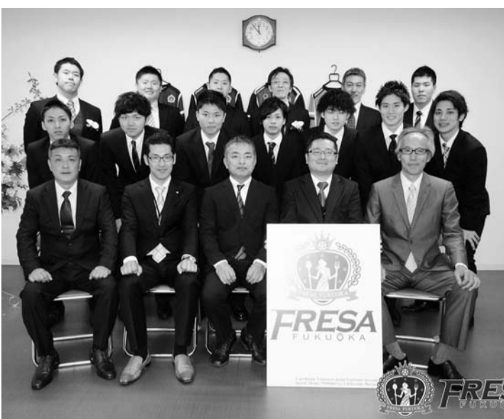
農家の人たちと記念写真に収まる選手たち

今回、縁あって、糸島市に本拠地を構える「フレッサ福岡」というハンドボールチームを設立した。