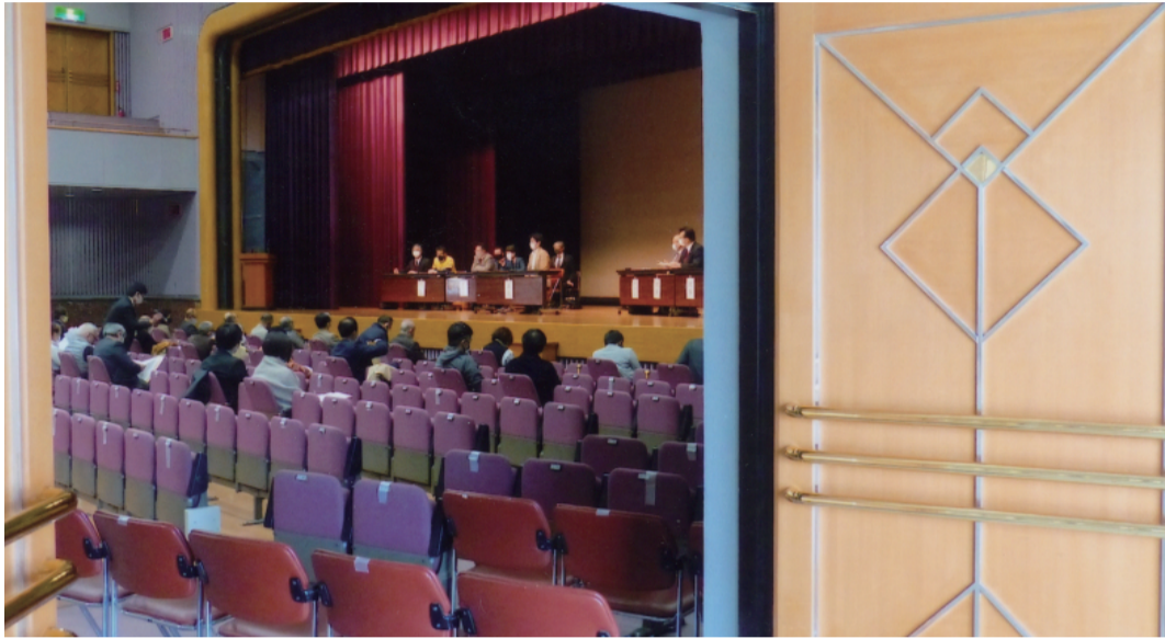
換気のため扉を開放して開かれた3月の常任幹事会=筑紫丘高校講堂

同窓会の令和2年度第3回常任幹事会が同3年3月13日開催された。コロナ禍により常任幹事会は第1回、第2回ともに中止となったが、今回は1500人収容可能な本校講堂を会場にした。「密」を避けるため座席指定とし、出入口の扉を開けて換気をするなど感染防止対策を十分に講じた会議として開催した。コロナ禍で昨年中止となった定期総会は今年も当初の6月から10月2日に延期、本校講堂の座席指定形式で開催することになった。並びに6年後の2027年に迫った本校創立100周年の記念事業実行委員会の設立も決議された。(事務局)