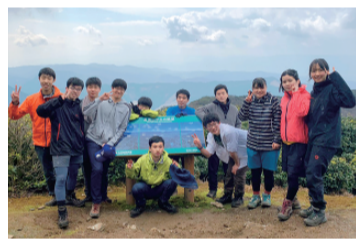
2泊3日の春合宿に参加した部員たち=朝倉市の馬見山

私たちは木曜日以外、週に4日活動をしています。休日には大会に向けての試走やトレーニングのために県内の山に登っています。部員は男子9人、女子4人の計13人で理科の生徒も在籍しています。山頂付近では福岡県一帯を見渡すことができ、四季折々の景色を楽しむことができます。山岳部の大会はさまざまな項目で採点が行われ、合計の得点を競います。採点される内容はテントを張る技術や地図を見て現在地を読み取るテストなどがあります。