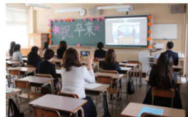
卒業生とは別の教室で、卒業式の模様をカメラ越しに見守る保護者たち

保護者には映像配信 例年とは違う形で 卒業式・入学式・入会式 第73回卒業証書授与式が令和3年3月1日行われ、435人の生徒が筑紫丘を巣立っていきました。今年も新型コロナウイルス感染防止のため式典が大幅に短縮されたほか、密を避けるために保護者の講堂への入場不可、在校生の参加は代表生徒1人のみとなりました。代わりに講堂内の映像が各教室の電子黒板に配信され、保護者はそれを観覧する形式が取られました。式終了後の最後のホームルームでも、密を避けるため卒業生と保護者が同じ教室に入ることにはできませんでしたが、卒業生の教室と保護者の教室がweb会議形式で接続され、卒業生435人 同窓会に迎える 翌日に卒業を迎える高校73回の卒業生435人の同窓会入会式が令和3年2月28日、本校講堂で行われた。大学受験中で進路が未定だったが、同窓会からのこれまでの支援への感謝と、進路への強い決意が表明された。同窓会は旧制中学の開校以来、卒業生総数3万8373人となった。