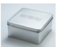
①ガオカン 一無二の校

令和6年度首都圏福岡総会物販リダイ毎年、幹事学年が企画・製作を担当させていただき同窓会グッズ。今年も充実のラインナップで完成しました。二つ紹介します。一番のお薦めは「ガオカン」Ⅱ写真①Ⅱです。そうです、缶です。日本でも筑紫丘高校にしかない唯一無二の校