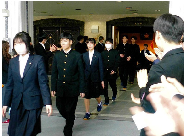
教職員らの拍手の中、退場する卒業生

筑高生として最後となる校歌斉唱も朗々と歌い上げました。最後、晴れやかな笑顔の生徒、涙を浮かべる生徒など、様々な表情を示しながら堂々と講堂を退場していきました。一方、令和6年度入学式は4月9日に