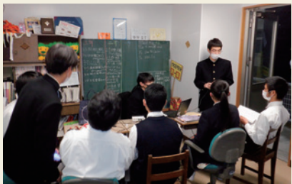
(問題を出し合っている)部活動中の生徒たち

筑高クイズでは、全5問のテール平均正解率が5割以下という難問に加え、MCのアラブの大富豪が途中から綱タイツのバニーガールに変身するわ、もうちゃっちゃくちゃらたい。